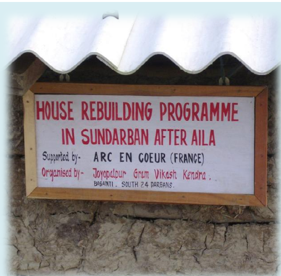
Maison reconstruite suite au programme d'AEC en 2010