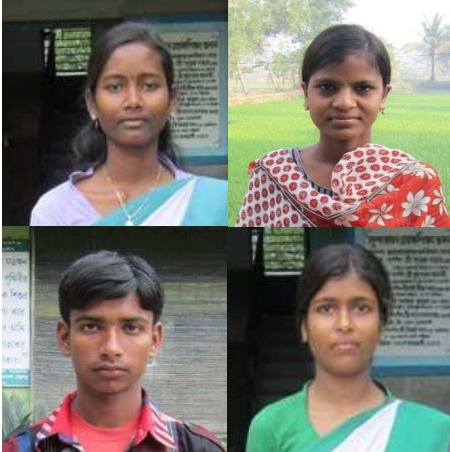
4 étudiants ayant rejoint le programme

En Janvier 2013, quatre nouveaux enfants ont rejoint le programme de parrainage. Tous ont des points communs : issus de famille avec peu de ressources, ils ne peuvent financer l'ensemble des frais scolaires bien que leur volonté de réussir leurs études soit exemplaire.